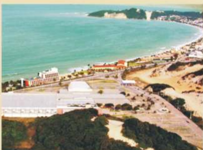
Centro de Convenções - Via Costeira